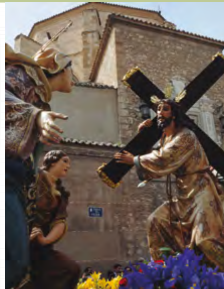
Imagen Titular: Encuentro de Jesús con su Madre camino del Calvario (José María Rausell Montañana y Francisco Llorens Ferrer, 1946).

SALIDA SAN PEDRO 11:20 | RUIZ MOROTE | PALOMA | CALATRAVA 12:00 | TOLEDO 12:10 | ESTACIÓN VIA CRUCIS 12:35 | PLAZA DEL CARMEN | AZUCENA 12:55 | CAMARÍN 13:10 | PRADO 13:20 | PLAZA MAYOR 13:40 | CUCHILLERIA-RUIZ MOROTE 14:05 | ENTRADA SAN PEDRO 14:25