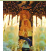
Imagen Titular: Virgen de los Dolores (Anónima, 1943).

SALIDA GUARDAPASOS 20:00 | LIRIO, NORTE Y SANTIAGO 20:30 | ALTAGRACIA 21:00 | ESTRELLA 21:30 | ELISA CENDRERO 22:00 | CALATRAVA 22:30 | ANGEL 22:50 | SANTIAGO (HERMANAS DE LA CRUZ) 23:00 | PASEO CRISTO DE LA CARIDAD 23:30 | CAÑAS-FELIPE II 23:45 | JUAN DE AVILA-QUEVEDO 0:00 | ENTRADA GUARDAPASOS 0:15