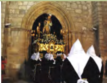
Imagen Titular: Virgen del Mayor Dolor (José María Rausell Montañana y Francisco Llorens Ferrer, 1944).

SALIDA DE SAN PEDRO 0:00 | GENERAL REY | MATA | COMPAS DE STO. DOMINGO 0:20 | LIRIO | NORTE | PLAZA DE SANTIAGO 1:10 | ANGEL | JACINTO | ALTAGRACIA | ESTRELLA | ELISA CENDRERO | CALATRAVA | TOLEDO | ESTACIÓN VIA CRUCIS | PLAZA DEL CARMEN | AZUCENA | PRADO | FERIA | MARIA CRISTINA | PLAZA MAYOR | CARLOS VÁZQUEZ | RUIZ MOROTE | ENTRADA SAN PEDRO 3:15